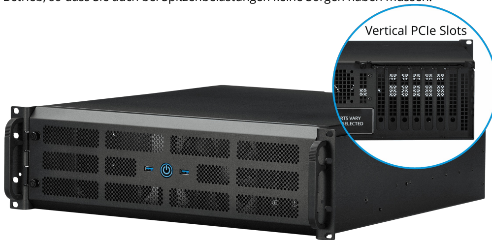
Vertical PCIe Slots

Entfesseln Sie das Erweiterungspotenzial dieses 3U-PCs, der mit vertikalen PCIe-Steckplätzen ausgestattet ist. Ganz gleich, ob Sie kritische Workflows verwalten oder ressourcenintensive Aufgaben bewältigen müssen, es stehen bis zu 7 PCIe-Steckplätze zur Verfügung, die eine nahtlose Integration von NVIDIA-GPUs der Quadro-Serie für robuste Multi-PCI-Konfigurationen gewährleisten und das System zu einem echten Gewinn für anspruchsvolle Anwendungen machen. Seine vielseitigen Hot-Swap-Festplatteneinschübe nehmen bis zu 8x 2,5"-Laufwerke, 2x 3,5"-Laufwerke oder 6x NVMe/U.3-Optionen auf und bieten so eine beispiellose Flexibilität für Speicherlösungen mit hoher Dichte. Trotz seiner leistungsstarken Funktionen hat der 3U-PC einen kompakten Formfaktor von 425x457x133 mm und spart so wertvollen Platz im Rack, ohne an Leistung einzubüßen. Die redundanten Stromversorgungsoptionen sorgen für einen unterbrechungsfreien Betrieb, so dass Sie auch bei Spitzenbelastungen keine Sorgen haben müssen.